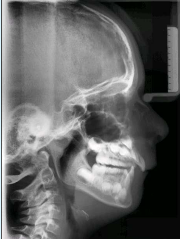
1999-08 Before FKO