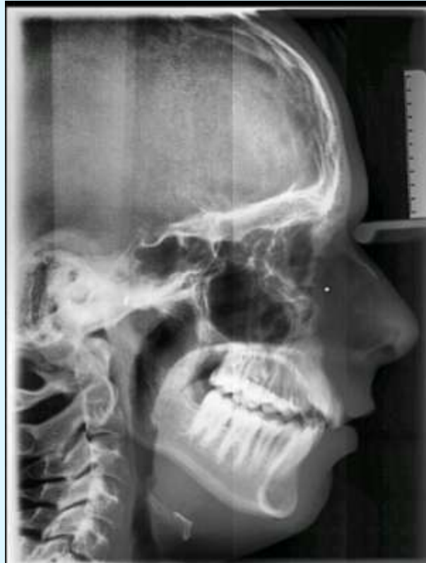
2005-06 After FKO, before KFO