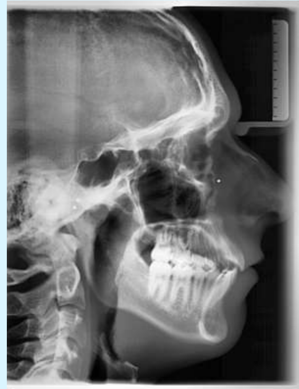
2008-02 After KFO