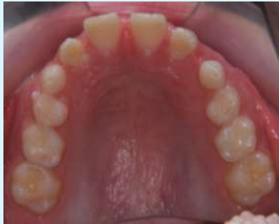
Before FKO 2005-11