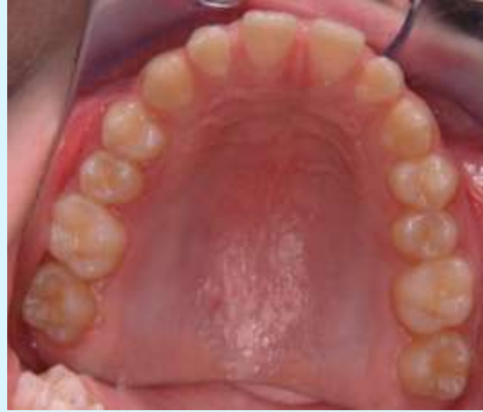
After FKO 2008-07