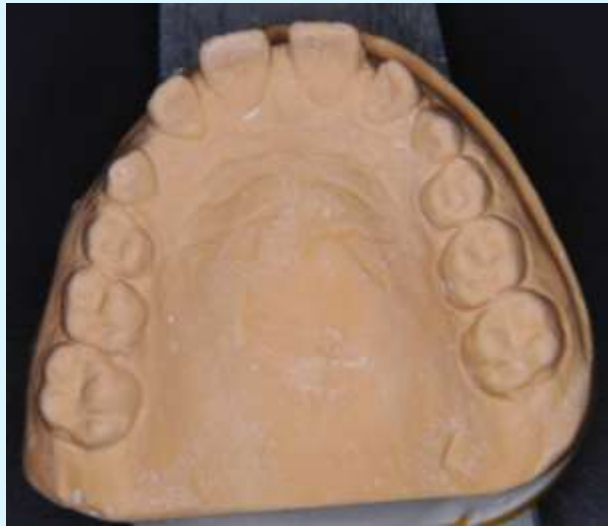
Before FKO 2005-11