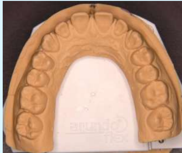
After FKO 2008-07