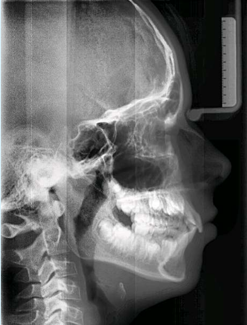
Before FKO 2005-11